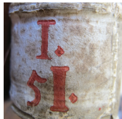
Abb. 1-3: Signaturetiketten in rot oder schwarz, mit oder ohne Buchstaben, spätes 18. oder frühes 19. Jahrhundert