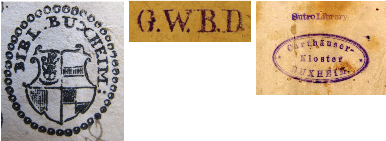
Abb. 4-6: Exlibris-Stempel: 4. Bibl. Buxheim (Kartausenbibliothek, 18. Jh.); 5. G.W.B.D (Gräflich Waldbott-Bassenheim'sche Dominialverwaltung, 19. Jh.); 6. Adolph Sutro Bibliothek, San Francisco (für die 1883 ersteigerten Bände angefertigt). Verbleib: verschollen, wahrscheinlich 1906 vernichtet