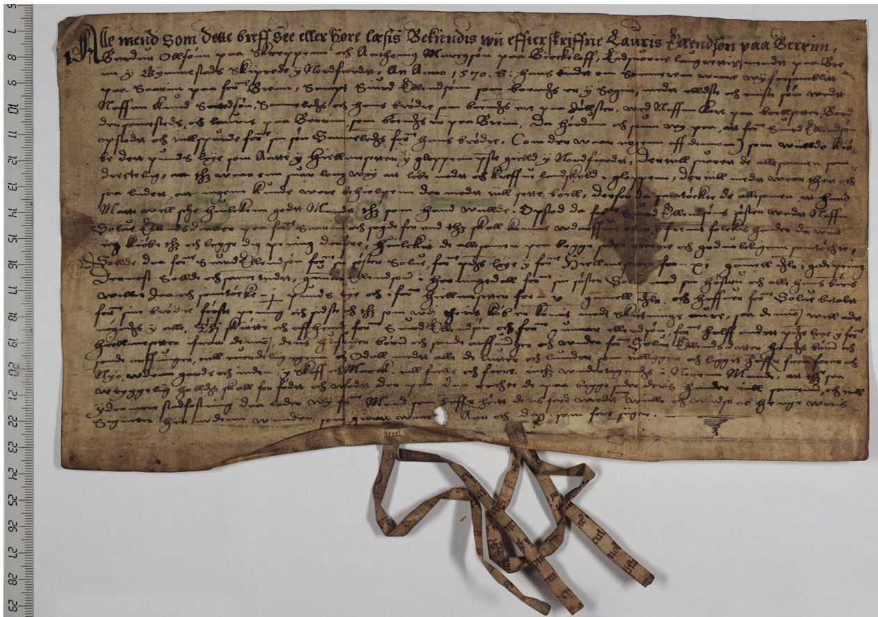
Abb. 2: MS 1550.5, verso: Altnorwegische Urkunde (16. Jh.)